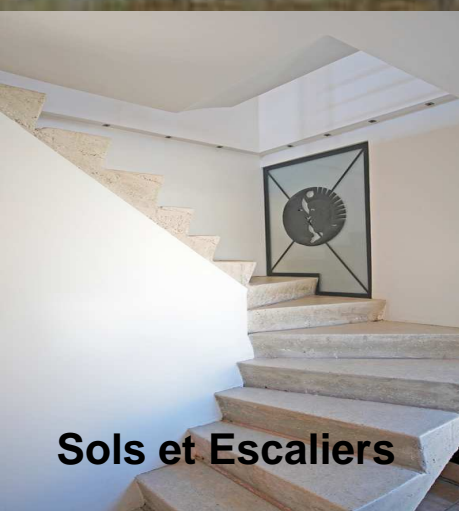
Sols et Escaliers