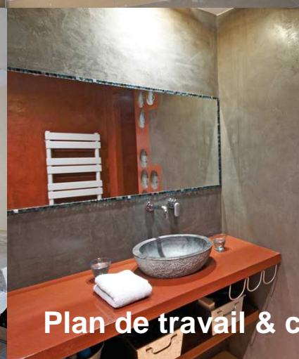
Plan de travail & crédence